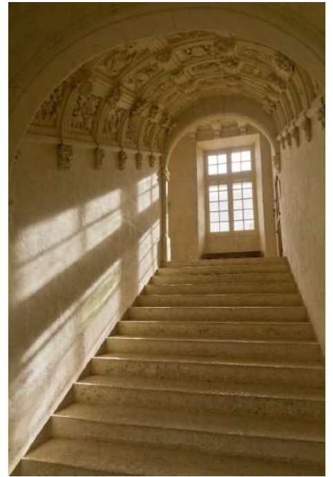
L'escalier à caissons Renaissance

Le jardin, classé "Jardin Remarquable", se compose d'un parterre à la française au tracé symétrique. Il est bordé d'un labyrinthe de charmilles, en son centre trône un platane séculaire. A l'arrière du château, un jardin à l'italienne fut créé en 1930 .