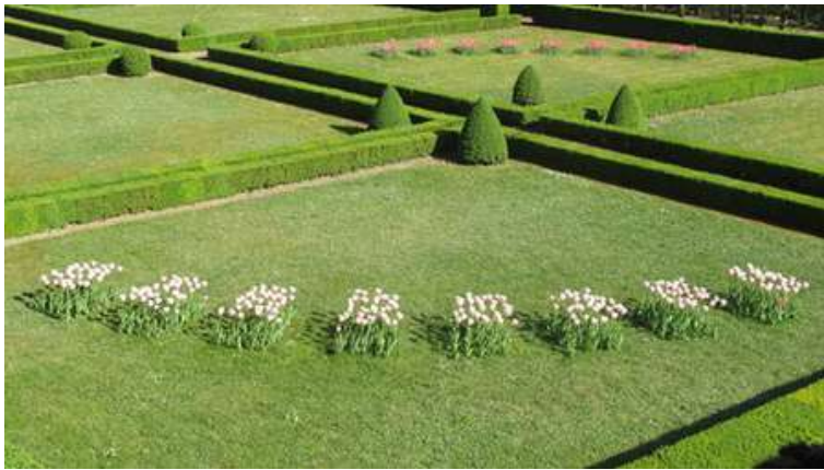
Les jardins à la française

L'escalier à caissons Renaissance est l'un des plus remarquables répertorié en France. Ses voûtes entièrement sculptées, rassemblent plus de 160 motifs allégoriques, mythologiques, héraldiques comme la célèbre salamandre de François I er .