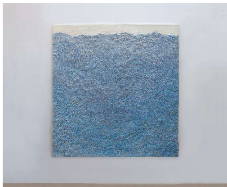
Valérie Novello Lointain / bleu , papier du Japon / pastel, 200 x 210 cm, dimensions variables, 2022

2020 Artfait Paratissima, Torino, Italia Art Woman , Fondazione Palmieri, Lecce Italia Yiri Arts Gallery Wisppers of the shores , Tapei, Taïwan Art Fair, Bologne, Italia