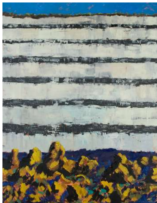
Guy de Malherbe, Falaise, huile sur toile, 250 X 200 cm, 2013