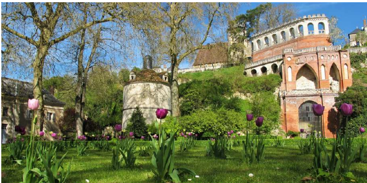
Les jardins avec le pigeonnier du XVI ème siècle et la folie néogothique de 1830

Enfin, surplombant les jardins, la Terrasse Caroline offre un impressionnant décor de briques et de pierres. Telle une ruine, elle célèbre le goût néogothique des années 1830.